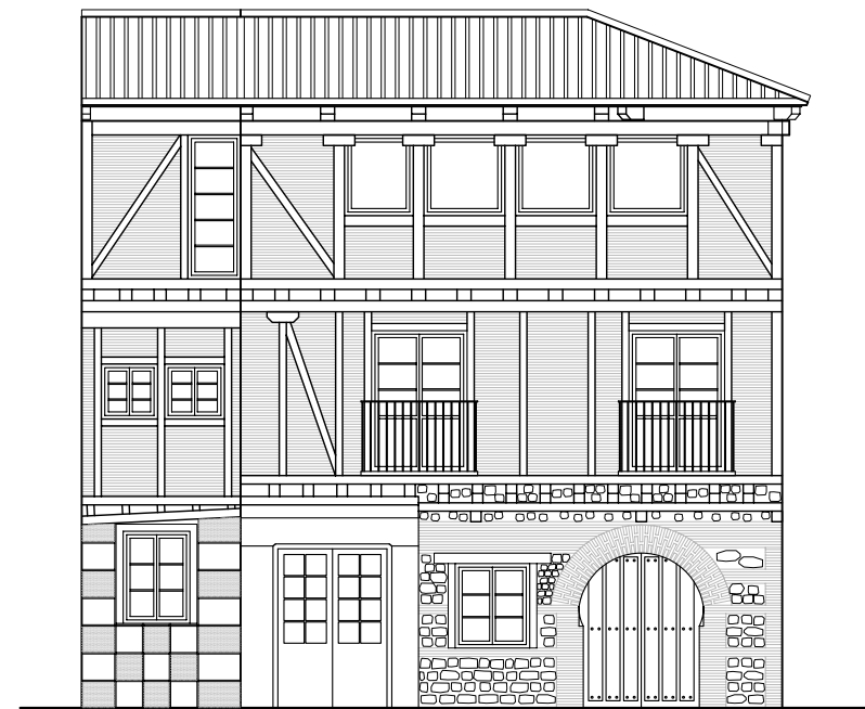
ALZADO C/ ALMUZARA