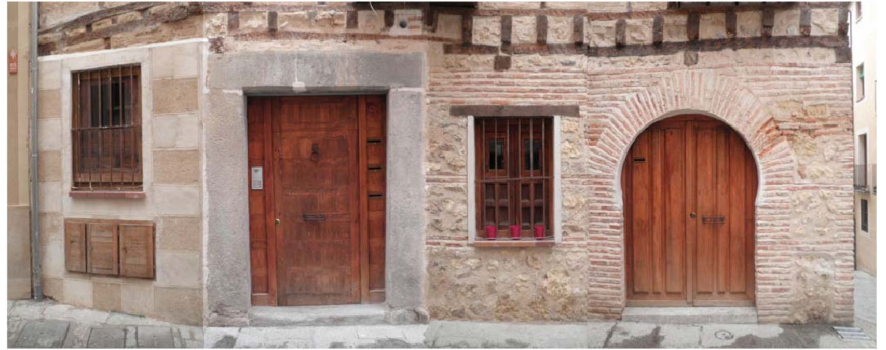
ESTADO REFORMADO. DETALLE DE FACHADA DE PLANTA BAJA.