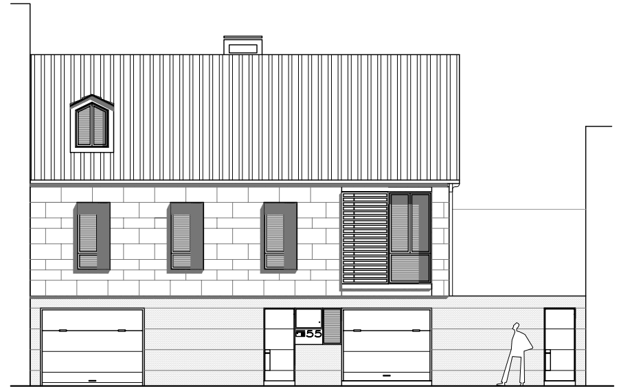
ALZADO PRINCIPAL A CALLE ROSARIO